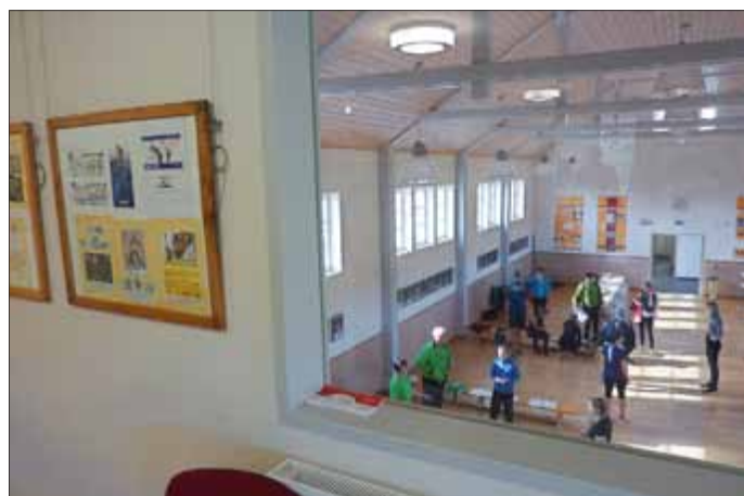
Schau und Abnahme des Sportabzeichens in der GutsMuths-Gedächtnishalle Schnepfenthal am 16.9.2017