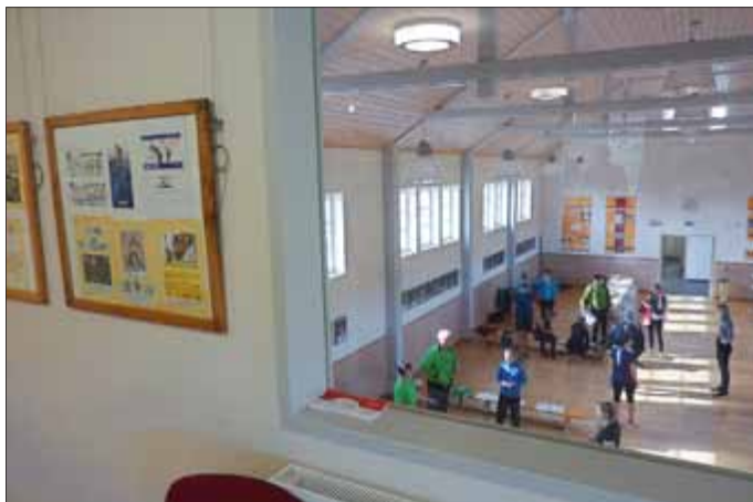
Schau und Abnahme des Sportabzeichens in der GutsMuths-Gedächtnishalle Schnepfenthal am 16.9.2017