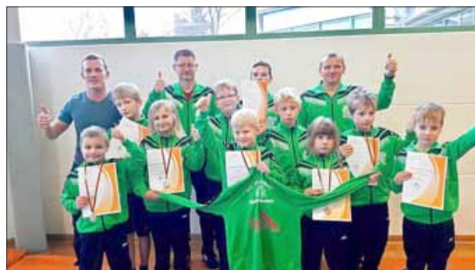
Mannschaftsfoto „Daumen hoch“

Der Karnevalsverein hat für die tollen Tage weder Mühen noch Kosten gescheut, ein abwechslungsreiches Programm auf die KTW-Bühne zu bringen. Schon die ersten beiden Abende versprechen Highlights zu werden. Beim Jugendfasching am 17. Februar, ab 21 Uhr (eine Stunde Happy Hour und Eintrittspreisnachlass) legen die „Soundmietzen“ auf. Und tags darauf am 18. Februar ab 20.11 Uhr für die Junggebliebenen