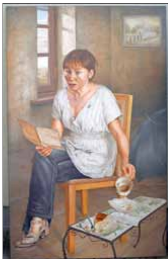
Uwe Lüdecke: Die Botschaft, Öl/Leinwand, 2011

30. 4. - 28. 5. 2017: Di. 10 - 13 Uhr, Mi 13 - 17 Uhr, So. 14 - 17 Uhr