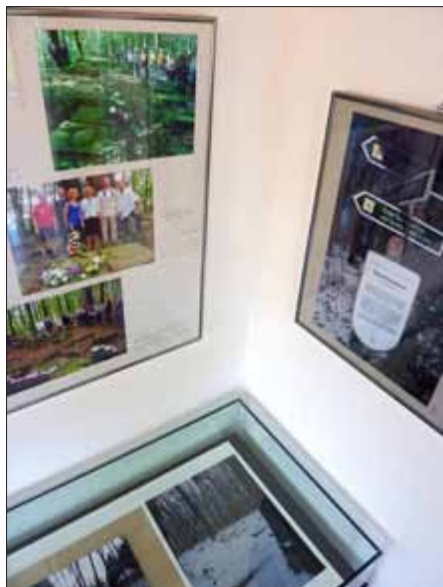
In der Ausstellung „Historischer Waldfriedhof Schnepfenthal“: „Bei GutsMuths daheim“ am 21.05.2017 - oberes Bild im Rahmen.