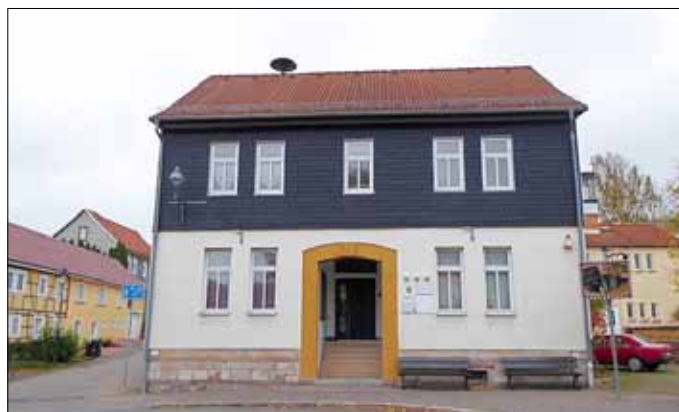
Wohn- und Geschäftshaus, Wintersteiner Landstraße 1