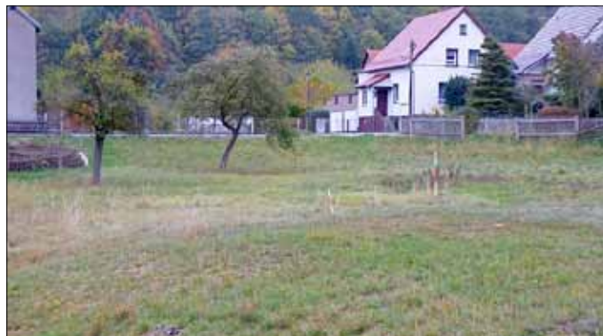
Blick zur Untergasse / mögliche Bebauung