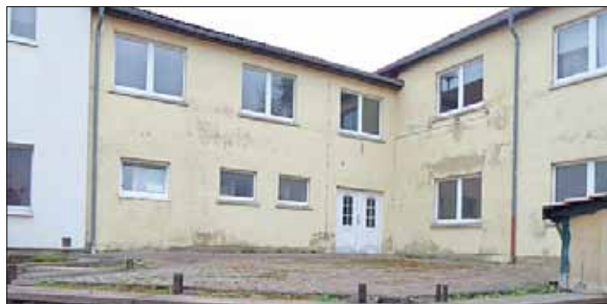
ehemaliges Kulturhaus, Wintersteiner Landstraße 2