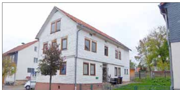
Wohnhaus, Wintersteiner Landstraße 4

Schriftliche Gebote sind in einem verschlossenen Umschlag mit der Aufschrift „Kaufgebot Grundstücke Schmerbach“ nicht vor dem 14.12.2018, 10.00 Uhr öffnen“ bis zum 14.12.2018, 10.00 Uhr zu richten an: