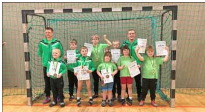
Die erfolgreiche Mannschaft der ZSG Grün-Weiß Waltershausen