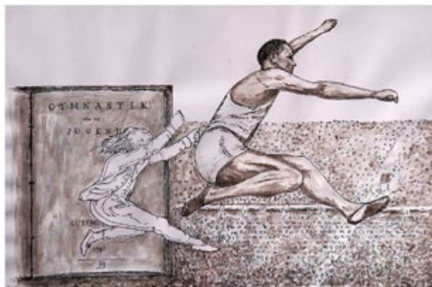
Horst Krieg, GutsMuths lebt! Jesse Owens in Berlin 1936

Laufzeit beider Sonderausstellungen: 10. 7. - 8. 8. 2021