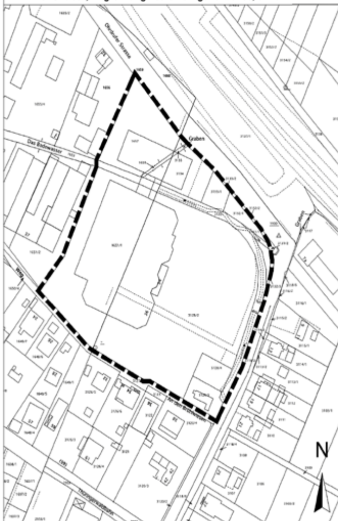
1. Änderung des Bebauungsplanes Nr. 21 "Sondergebiet Einkaufszentrum Ohrdruffer Straße"; Abgrenzung des Geltungsbereiches, ohne Maßstab

Der Aufstellungsbeschluss ist gemäß § 2 (1) BauGB ortsüblich bekannt zu machen.