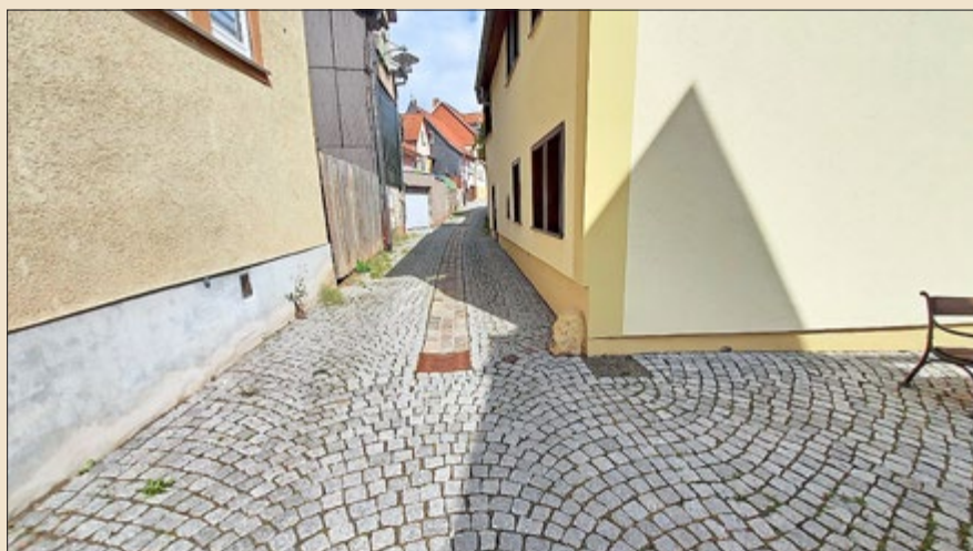
Ansicht vom Plan mit Abbruchlücke links

Mit Ihren Ideen oder Anregungen bezüglich Baumaßnahmen wenden Sie sich bitte an das Bauamt (03622/630170 oder 03622/630171) der Stadt Waltershausen. Wir freuen uns!