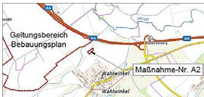
Übersichtsplan mit 3. Geltungsbereich

Der geänderte Entwurf des Bebauungsplans Industrie großfläche „Industriegebiet Waltershausen-Ost/Hörselgau“, mit Stand April 2022, bestehend aus der Planzeichnung mit textlichen Festsetzungen, Begründung mit Umweltbericht und den für das Plangebiet erstellten Fachgutachten sowie die der Stadt Waltershausen bereits vorliegenden umweltbezogenen Stellungnahmen und die den Festsetzungen zugrundeliegenden DIN-Normen liegen zur Einsicht