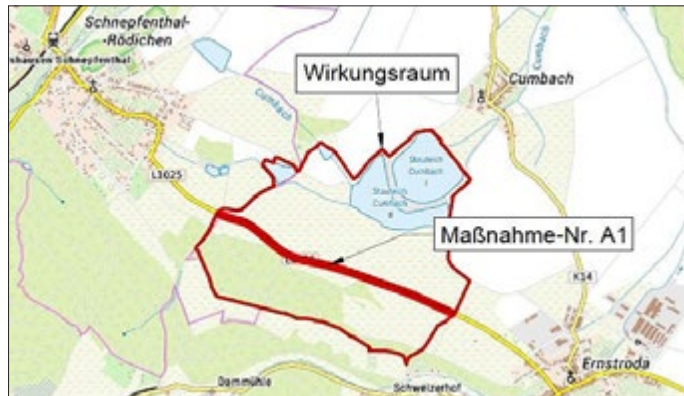
Übersichtsplan mit 2. Geltungsbereich