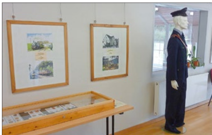
175 Jahre Thüringische Eisenbahn: Vitrine mit Medaillen von Hans-Joachim Möller, Bilder von Peter König und „Zugführer“ von Klaus-Dieter Erdmann

Kommen Sie und lassen sich bezaubern von den Präsentationen zur Kunst und zum Sport bei GutsMuths!