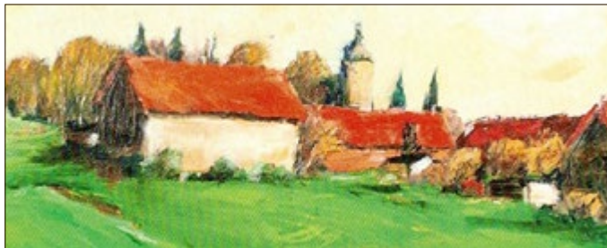
Jürgen Weis: Remstädt, Ausschnitt vom Ölgemälde

Weitere Informationen auf der Homepage der Stadt Waltershausen www.waltershausen.de