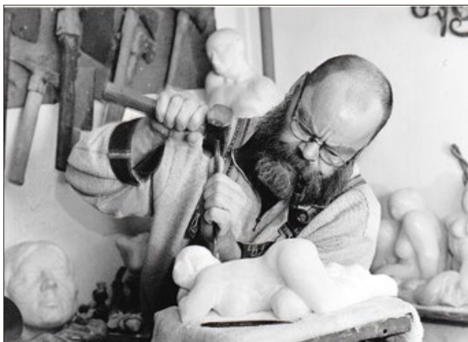
Rüdiger Wilfroth im Atelier in Leina

Rüdiger Wilfroths Skulpturen sind im öffentlichen Raum, insbesondere in Thüringen und Sachsen erlebbar. In Gotha erinnern die Skulpturen „Familie“ in der Hützelsgasse, „Neubeginn“ im Lesecafe der Stadtbibliothek „Heinrich Heine“ sowie „Großes Erwachen“ im Amalienhof der Bibliothek an das umfangreiche Werk des 2015 verstorbenen Künstlers.“