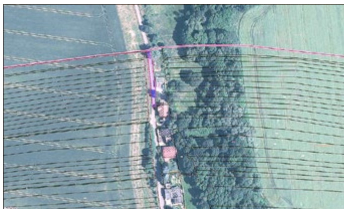
Friedhofstraße 24, 99891 Bad Tabarz Gemarkung Tabarz - Flur 9 - Flurstück 1207