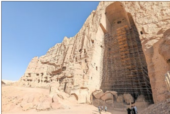
Afghanistan: Buddha-Felsen von Bamiyan

Das GutsMuths-Veranstaltungsjahr hat sehr gut begonnen. In der ersten Jahreshälfte zeigen wir 6 Sonderausstellungen und in jedem Monat - Vortrag, Gesprächsrunde oder Lesung!