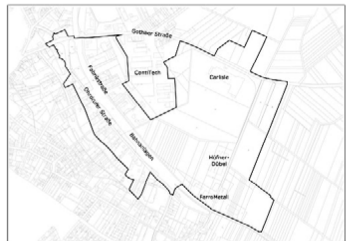
Geltungsbereich des B.-Planes Nr. 12 „Gewerbe-/Industriegebiet Gothaer Straße und Mischgebiet Ohrdruffer Straße“