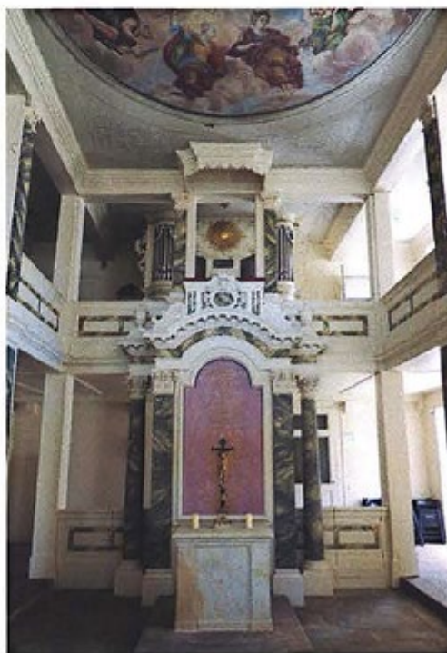
Altar Schloss Tenneberg

Leipziger Buch- & Kunstantiquariat www.ulbricht-kunstauction.de