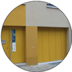
Fassadengliederung mit Garage im EG

Dachgestaltung: - Satteldach - Staffelgeschoss