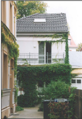
Wohnen im Hinterhof

Dachgestaltung: - Satteldach - Staffelgeschoss