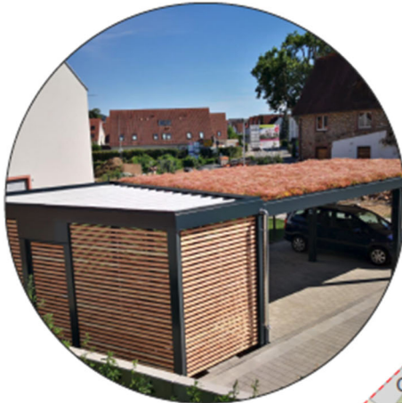
Carport mit angrenzendem Anbau (Schuppen)

EINE MARKE DER UNTERNEHMENSGRUPPE NASSAUISCHE HEIMSTÄTTE | WOHNSTADT