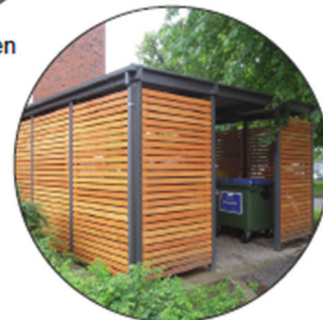
Einhausung als Abstell- Möglichkeiten z.B. - Mülltonnen - Fahrräder