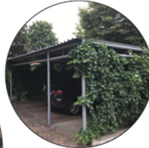
Carports mit Begrünungen - Fassaden - Dach