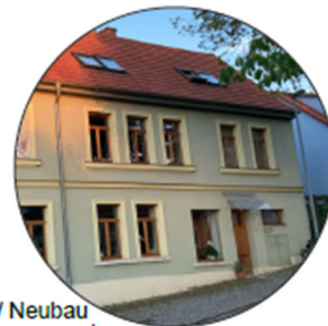
Bebauung / Neubau an Baustil angepasst

Dachgestaltung: - Satteldach - Staffelgeschoss