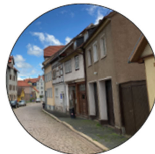
Straßenbild der Brühlgasse