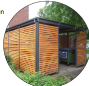
Einhausung als Abstell- Möglichkeiten z.B. - Mülltonnen - Fahrräder