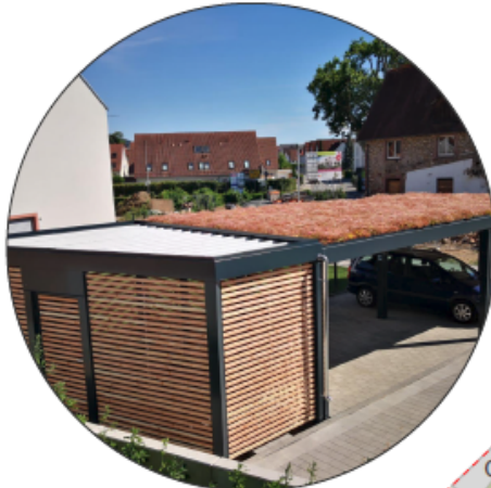
Carport mit angrenzendem Anbau (Schuppen)

EINE MARKE DER UNTERNEHMENSGRUPPE NASSAUISCHE HEIMSTÄTTE | WOHNSTADT