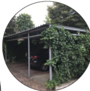
Carport mit Begrünungen - Fassaden - Dach